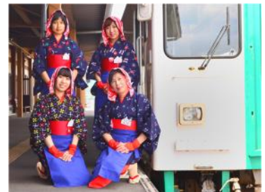
秋田おばこがお出迎え