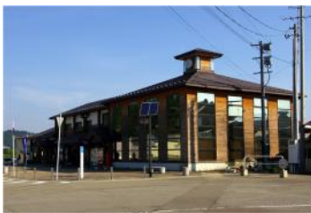
由利高原鉄道 矢島駅

県・山形県 各々15カ所 計30カ所のスタンプ設置施設があります。そのひとつ、秋田県由利本荘市 由利高原鉄道 矢島駅を紹介します。