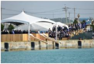
（写真はイメージです。）

多くのご来賓の方々をお招きし、地元漁業者のご協力のもと記念放流と漁船による海上歓迎パレードを本番さながらに行います。記念放流では、本大会と同じヒラメ、トラフグ、クロダイを放流します。海上歓迎パレードでは、漁法紹介とともに多くの漁船が賑やかに海上をパレ