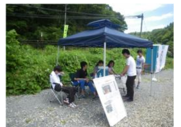
第2駐車場でマップを提供