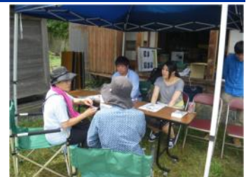
極楽寺でのおもてなし