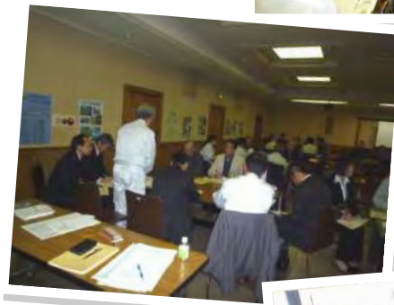
交流会・意見交換会の様子