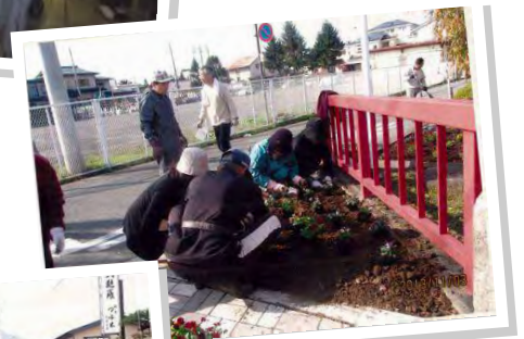
サポート団体「天童市東本町町内会」活動の様子