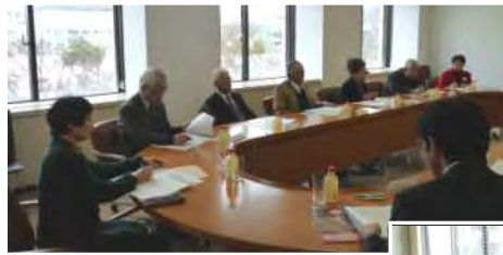
少子高齢化が進む中でいかに地域活性化を図るかなどについて委員の地域での活動などが報告された。 西村山・北村山地域知恵袋委員会

今回の委員会では、7月に開催された第1回委員会で委員から出された意見について、新年度予算への反映状況などもふまえた県の取組み状況を報告しました。委員の皆さまからいただいたご意見を生かして、各種事業に取り組んでまいります。（総務課 023-621-8107）