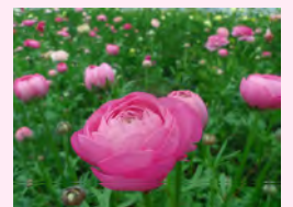
色鮮やかに春を彩るランキュラス。花卉が幾重にも重なり、優雅な花として人気です。

■発行元■ 村山総合支庁総務企画部 総務課総合案内窓口 Tel. 023-621-8107 Fax.023-624-3056