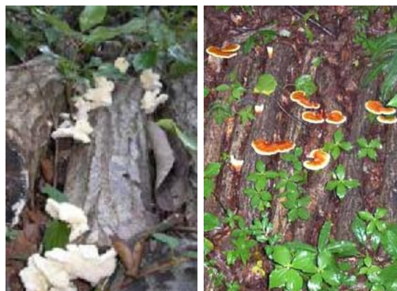
発生中のウスヒラタケとマンネンタケ