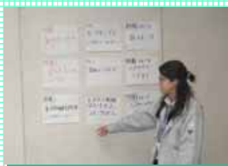
各班掲載ネタ発表