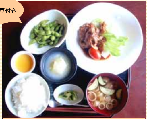
昼膳(750円)メニュー例 黒豚のごまだれ焼き