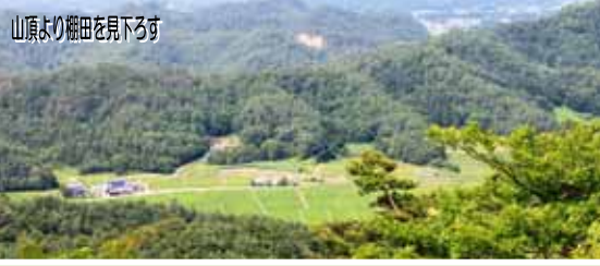
山頂より棚田を見下ろす