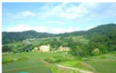
豊牧地区から滝の沢地区を望む。手前もあちらも棚田。