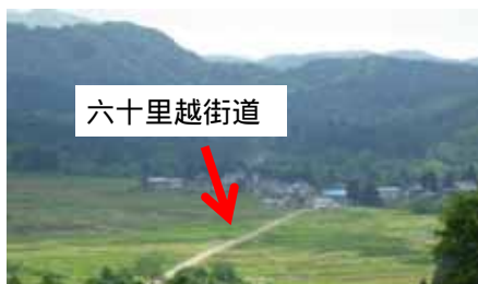
トレッキングも企画される棚田と古道

大網地区（上村、中村、下村、七五三掛、関谷の5集落で構成）は、月山の西側の麓に位置する中山間地。月山や湯殿山からの湧水を大事に使って、稲作をしてきた地区だ。やまがたの棚田20選に選ばれた上村地区の棚田の中央を縦断するのは歴史ある古道・六十里越街道。棚田も古道も地域の人たちが大切に守り続けている大網地区の宝だ。