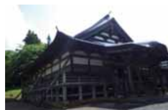
七五三掛地区の注連寺には即身仏も