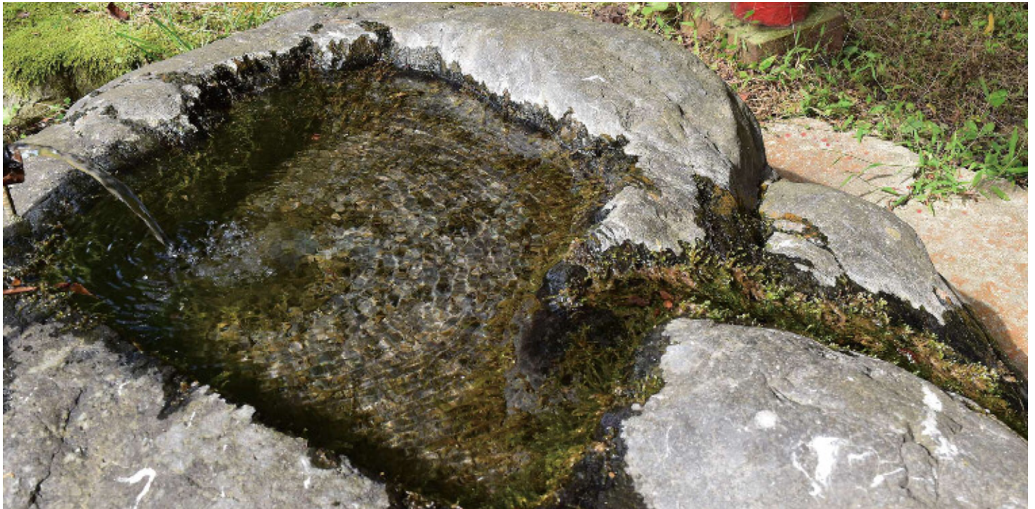
〔管理者〕 満澤神社 〔保全団体〕 満澤神社・上満澤観音講