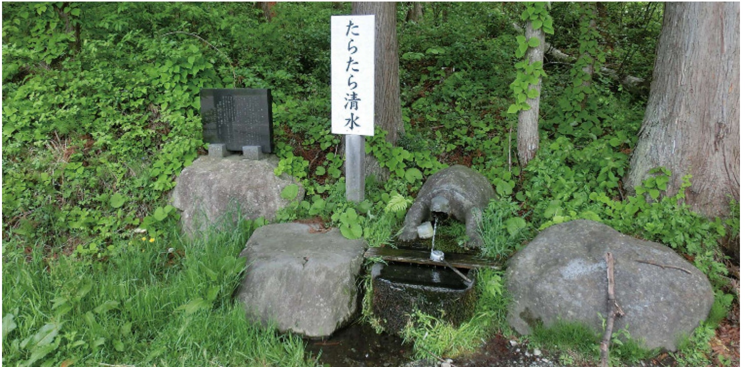
〔管理者・保全団体〕畑谷区