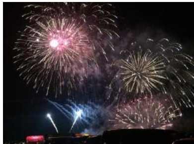
ゆげ町夕日まつり(遊佐町)