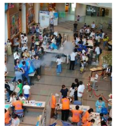
2019青少年のための科学の祭典 in山形(山形市)