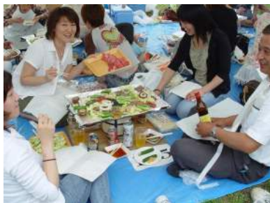
いいで黒べこまつり(飯豊町)