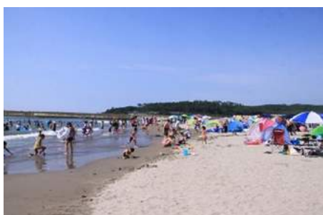
海水浴場開き(遊佐町)