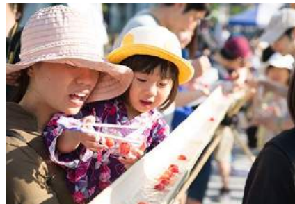
いいで添川温泉まつり(飯豊町)