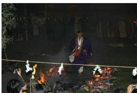
さくらんぼ東根温泉火渡り式(東根市)