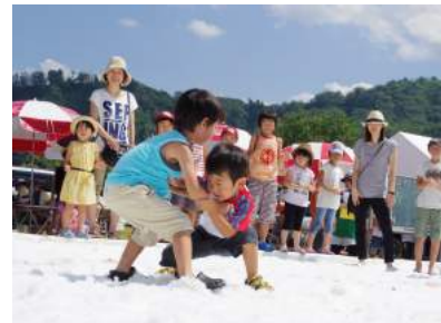
SNOWえっぐフェスティバル(飯豊町)