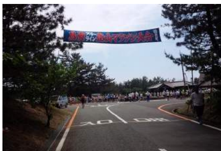
鳥海ブルーライン登山マラソン(遊佐町)