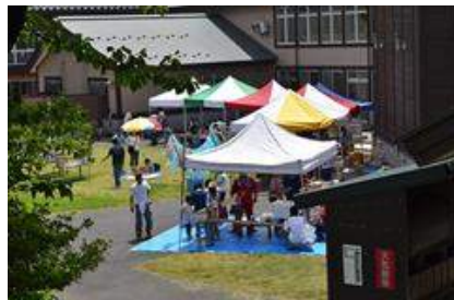
サマーフェスティバル in しらい(遊佐町)