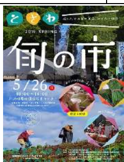
とざわ旬の市 -春- (戸沢村)