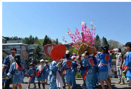
赤倉温泉 春祭り(最上町)