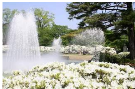
白つつじまつり(長井市)