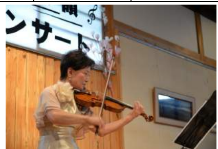
塚田分水嶺春のコンサート(最上町)