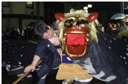
ながい黒獅子まつり(長井市)