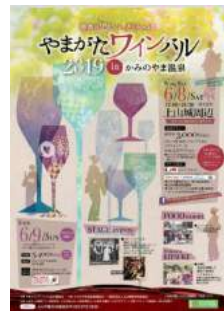
やまがたワインバル2019 in かみのやま温泉