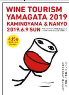
ワインツーリズムやまがた2019(上山市)