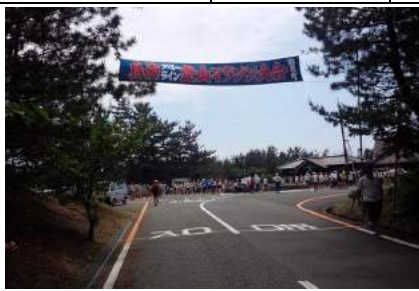
鳥海ブルーライン登山マラソン(遊佐町)