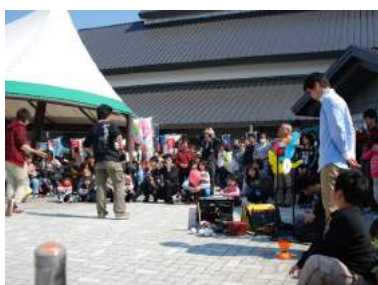
めざみ祭りGW(飯豊町)